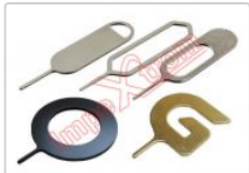
Herramienta de extracción de tarjeta SIM, 1 unidad

Para este manual necesitarás las siguientes herramientas y componentes que puedes adquirir en nuestra tienda on-line Impextrom.com Haz click encima de una herramienta para ir a la página web.