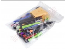
Conjunto de herramientas profesionales apertura de