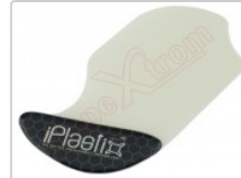
Herramienta plástica de apertura profesional iPlastix