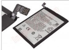
Batería bl270 genérica, compatible para motorola moto g6 play xt1922-3 /

Para este manual necesitarás las siguientes herramientas y componentes que puedes adquirir en nuestra tienda on-line Impextrom.com Haz click encima de una herramienta para ir a la página web.