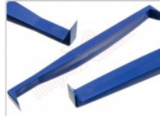
Herramienta de apertura para la reparación y desmontaje