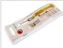
Destornillador de precisión con 5 puntas intercambiables