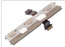
Pulsadores laterales para Huawei y5 (2018) dra-l21

Para este manual necesitarás las siguientes herramientas y componentes que puedes adquirir en nuestra tienda on-line Impextrom.com Haz click encima de una herramienta para ir a la página web.