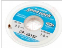
Malla desoldadora de estaño para electrónica, CP-2515