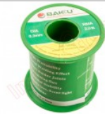
Bobina de estaño Baku 0.3mm 91.5g