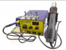
Estación de soldadura digital doble, Baku 601D SMD