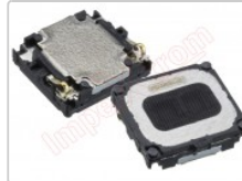
Altavoz auricular genérico de 8 x 9 mm