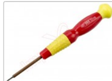
Destornillador profesional de punta torx de 2 x 40mm