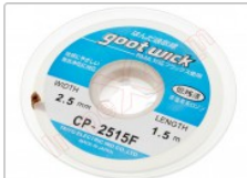
Malla desoldadora de estaño para electrónica, CP-2515 GOOT