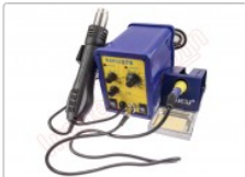
Estación doble de soldadura SMD, Baku 878