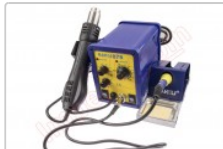
Estación doble de soldadura SMD, Baku 878