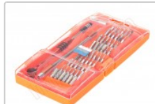
Kit de herramientas profesionales 58 en 1, Jakemy JM-8126