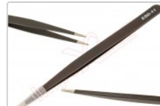
Pinzas ultrafinas rectas ESD-11