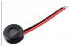
Micrófono genérico de 4.18 x 2.02 mm

Para este manual necesitarás las siguientes herramientas y componentes que puedes adquirir en nuestra tienda on-line Impextrom.com Haz click encima de una herramienta para ir a la página web.