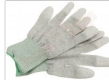
Guante ESD táctil para protección antiestática, talla S