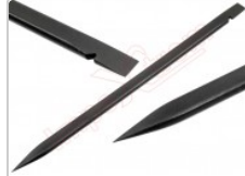
Herramienta de apertura Smartphone, móvil, tablet,