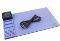
Tapete térmico de apertura mediante calor para pantalla de tablets y