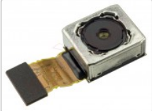
Cámara trasera de 21Mpx para Sony Xperia XA2 Ultra, H3213/ para Sony

Para este manual necesitarás las siguientes herramientas y componentes que puedes adquirir en nuestra tienda on-line Impextrom.com Haz click encima de una herramienta para ir a la página web.