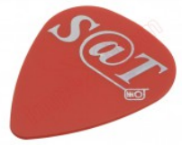
Púa especial SAT 0,75mm PVC policloruro de vinilo alta fricción