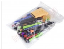
Conjunto de herramientas profesionales apertura de