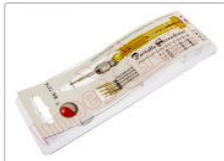
Destornillador de precisión con 5 puntas intercambiables

Para este manual necesitarás las siguientes herramientas y componentes que puedes adquirir en nuestra tienda on-line Impextrom.com Haz click encima de una herramienta para ir a la página web.