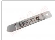
Herramienta metálica de apertura profesional iSesamo