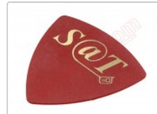
Púa especial SAT de 0.75mm de PVC de alta fricción