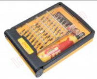
Destornillador con 30 puntas intercambiables JK 6032-A