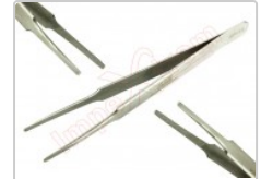
Pinza antiestática recta redondeada