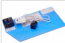
Tapete térmico de apertura mediante calor para pantalla de tablets y