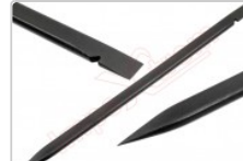
Herramienta de apertura Smartphone, móvil, tablet,