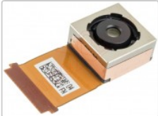
Cámara trasera de 12,19 Mpx MOTOROLA MOTO Z2 PLAY XT1709,

Para este manual necesitarás las siguientes herramientas y componentes que puedes adquirir en nuestra tienda on-line Impextrom.com Haz click encima de una herramienta para ir a la página web.