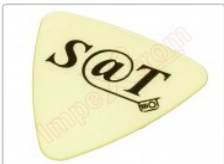
Púa especial SAT 0,70mm PEAD Polietileno de alta densidad alta fricción