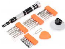
Kit de herramientas JM-8142 con destornillador profesional y 24