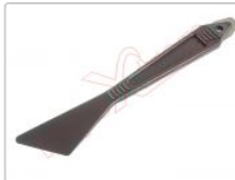
Herramienta de apertura smartphones y tablets Regen-i RG-