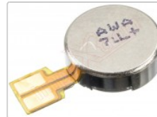
Vibrador Meizu M5 Note, M621H, Meizu M6 Note (M721H)/Meizu M6T