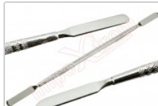
Espátula profesional de desmontaje para móviles y Smartphones