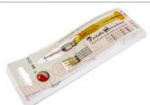
Destornillador de precisión con 5 puntas intercambiables