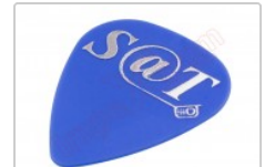
Púa especial SAT 0,70mm PET de alta fricción y resistencia