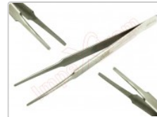
Pinza antiestática recta redondeada