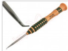
Herramienta profesional de punta curva para el desmontaje de