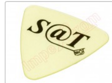
Púa especial SAT 0,70mm PEAD Polietileno de alta densidad alta fricción