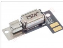
Vibrador para Xiaomi Mi Mix