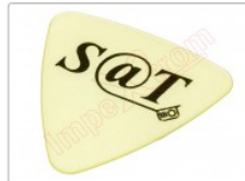
Púa especial SAT 0,70mm PEAD Polietileno de alta densidad alta fricción