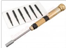
Destornillador de precisión 6 en 1, Best-8927A marrón

Para este manual necesitarás las siguientes herramientas y componentes que puedes adquirir en nuestra tienda on-line Impextrom.com Haz click encima de una herramienta para ir a la página web.