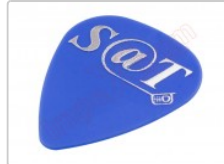
Púa especial SAT 0,70mm PET politereftalato de etileno de alta fricción