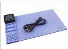
Tapete térmico de apertura mediante calor para pantalla de tablets y