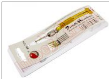
Destornillador 5 en 1 BK-7275