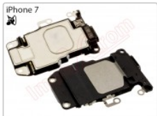
Módulo de altavoz tono de llamada para iPhone 7 de 4.7 pulgadas