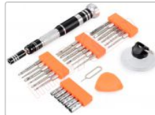
Kit de herramientas JM-8142 con destornillador profesional y 24