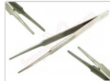
Pinza antiestática recta redondeada