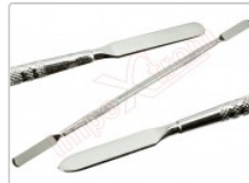
Espátula de desmontaje móviles y Smartphone