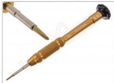
Destornillador con punta triwing 0.6 x 25 mm apertura de móviles y tablets

Para este manual necesitarás las siguientes herramientas y componentes que puedes adquirir en nuestra tienda on-line Impextrom.com Haz click encima de una herramienta para ir a la página web.