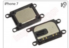
Módulo de altavoz auricular para iPhone 7 de 4.7 pulgadas