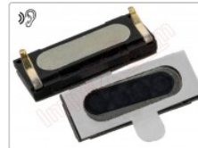
Altavoz auricular genérico de 14.93 x 6.01 x 2.88 mm