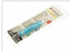
Destornillador BK-315 15 en 1 para Móviles y Tablets

Para este manual necesitarás las siguientes herramientas y componentes que puedes adquirir en nuestra tienda on-line Impextrom.com Haz click encima de una herramienta para ir a la página web.