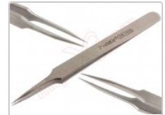
Pinzas con puntas profesional de 39MM