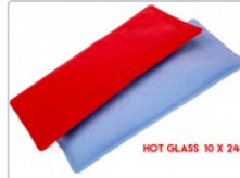
Manta calorífica Hot Glass 10x24 sección de pantallas táctiles y displays LCD