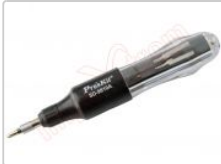
Destornillador de 10 puntas de cambio rápido