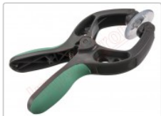
Ventosa para separar pantallas en smartphones, tablets y gadgets en general