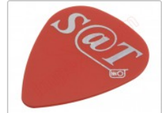
Púa especial SAT 0,75mm PVC policloruro de vinilo alta fricción