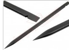
Herramienta de apertura Smartphone, móvil, tablet,