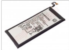
Batería EB-BG930ABE para Galaxy S7, G930F - 3000mAh / 3.85V /

Para este manual necesitarás las siguientes herramientas y componentes que puedes adquirir en nuestra tienda on-line Impextrom.com Haz click encima de una herramienta para ir a la página web.