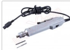
Destornillador eléctrico profesional de precisión