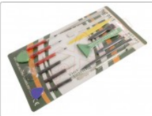
Kit de 17 herramientas reparación y apertura