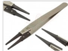
Pinzas antiestáticas VETUS ESD-249