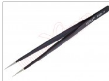
Pinza antiestática ESD redondeada