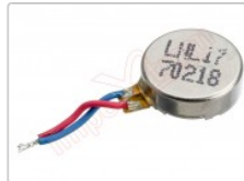
Vibrador genérico de 7,98 x 2,79 x 10,03 mm con cables