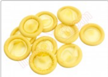
Set de 10 condones dedo antiestática ESD

Para este manual necesitarás las siguientes herramientas y componentes que puedes adquirir en nuestra tienda on-line Impextrom.com Haz click encima de una herramienta para ir a la página web.