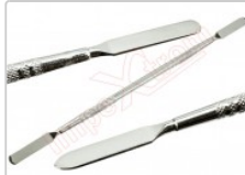
Espátula profesional de desmontaje para móviles y Smartphones