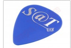
Púa especial SAT 0,70mm PET de alta fricción y resistencia