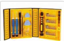
kit profesional de herramientas de reparación dispositivos