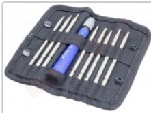
Estuche destornillador con 8 puntas Peng Fa 7339A