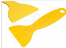
Herramienta, espátula antiestática ESD apertura de terminales y alisar