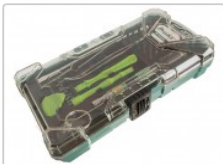
Estuche de herramientas de telefonía y PCs