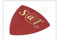
Púa especial SAT 0,75mm PVC policloruro de vinilo alta fricción