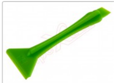
Herramienta plástica doble de apertura

Para este manual necesitarás las siguientes herramientas y componentes que puedes adquirir en nuestra tienda on-line Impextrom.com Haz click encima de una herramienta para ir a la página web.