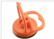
Ventosa de succión de 2.2 pulgadas desmontar display, pantalla táctil, es de