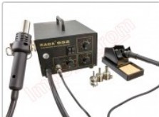
Estacion soldadura aire caliente + soldador