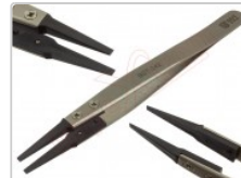
Pinzas antiestáticas BEST BST- 242