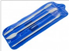
Conjunto de 3 espátulas de desmontaje de tablets y smartphones

Para este manual necesitarás las siguientes herramientas y componentes que puedes adquirir en nuestra tienda on-line Impextrom.com Haz click encima de una herramienta para ir a la página web.