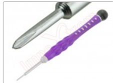
Destornillador profesional Tri-Wing Y 0,6 x 30mm

Para este manual necesitarás las siguientes herramientas y componentes que puedes adquirir en nuestra tienda on-line Impextrom.com Haz click encima de una herramienta para ir a la página web.