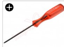
Destornillador phillips de estrella fino tamaño PH00