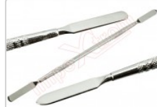
Espátula de desmontaje móviles y Smartphone