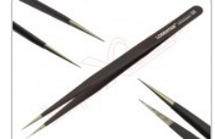
Pinza antiestática ESD-12