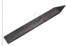
Herramienta de apertura gTool Screen Jack