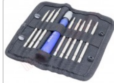
Destornillador con 8 cabezas intercambiables Peng Fa 7339A