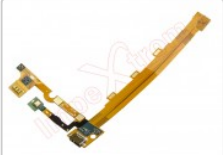
Flex con conector de carga, datos y accesorios micro usb para Xiaomi MI3

Para este manual necesitarás las siguientes herramientas y componentes que puedes adquirir en nuestra tienda on-line Impextrom.com Haz click encima de una herramienta para ir a la página web.