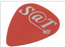
Púa especial SAT 0,75mm PVC policloruro de vinilo alta fricción