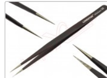
Pinza antiestática ESD-12