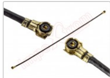
Cable coaxial de antena para Xiaomi Mi3

Para este manual necesitarás las siguientes herramientas y componentes que puedes adquirir en nuestra tienda on-line Impextrom.com Haz click encima de una herramienta para ir a la página web.