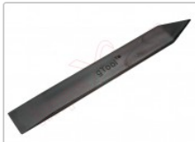
Herramienta de apertura gTool Screen Jack