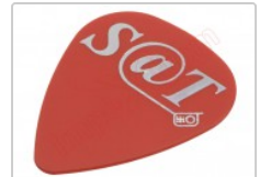
Púa especial SAT 0,75mm PVC policloruro de vinilo alta fricción