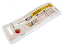
Destornillador de precisión con 5 puntas intercambiables