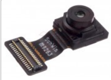
Cámara frontal de 8mpx para motorola moto e6 plus (xt2025-2)

Para este manual necesitarás las siguientes herramientas y componentes que puedes adquirir en nuestra tienda on-line Impextrom.com Haz click encima de una herramienta para ir a la página web.